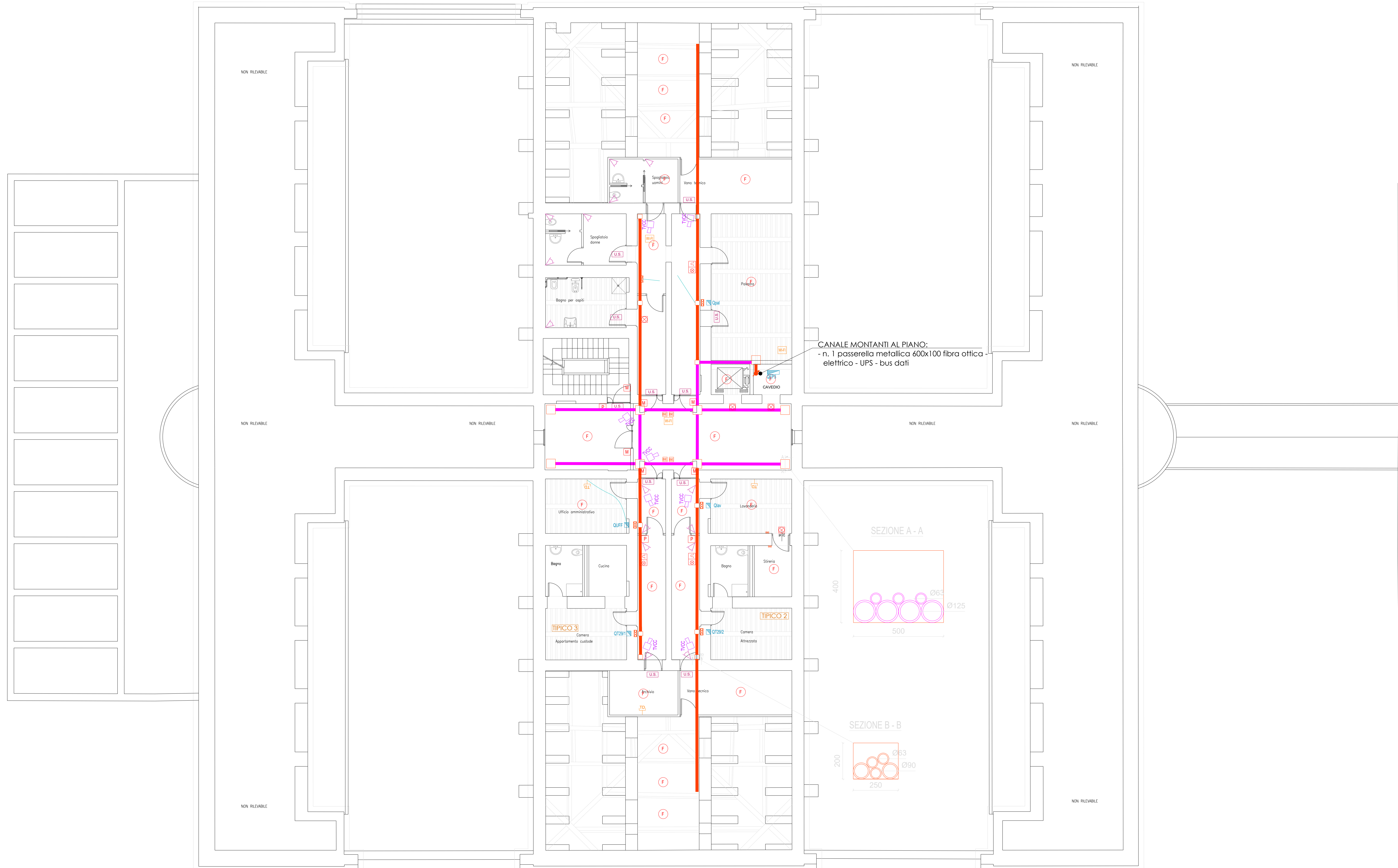
PIANTA PIANO TERZO - LIVELLO SOTTOTETTI (QUOTA VARIABILE)